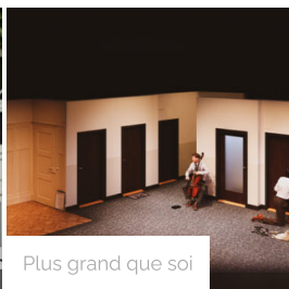
Plus grand que soi