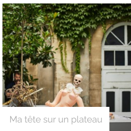
Ma tête sur un plateau